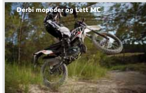
Derbi mopeder og Lett MC