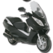
Satelis 125 s 11