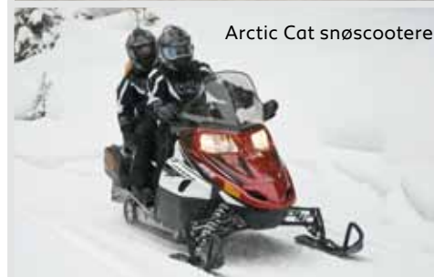
Arctic Cat snøscootere