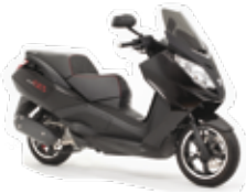
Satelis 500 s 11