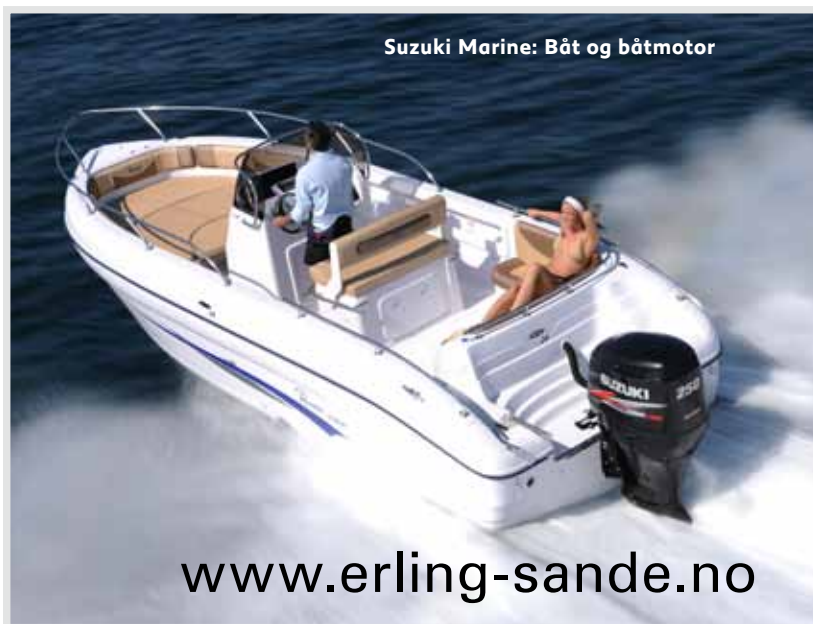
Suzuki Marine: Båt og båtmotor