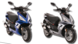
Speedfight Megawatt • s 9