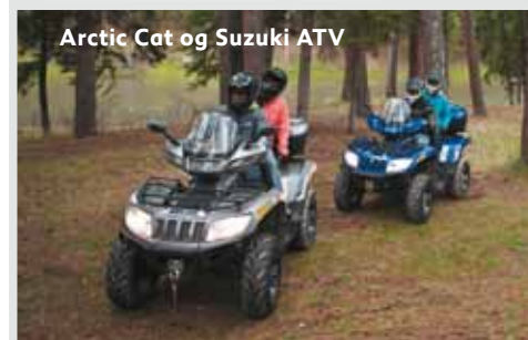
Arctic Cat og Suzuki ATV