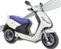
Viva city Electric • s 7