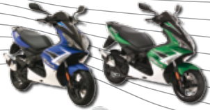
Jet force s 10