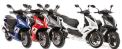
Speedfight • s 8